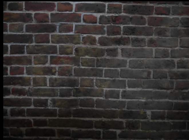
Fig. 06 - Interior Búnquer - Detalle pared