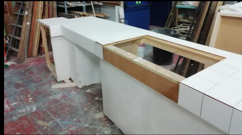
Fig. 02 - Encimera cocina - Construcción