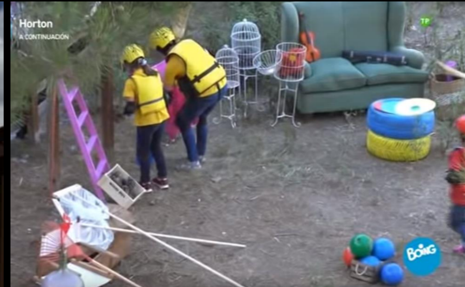
Fig. 02 - Exterior Palafito - Fotograma