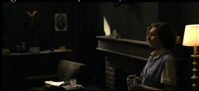
Fig. 01 - Interior Búnquer - Fotograma