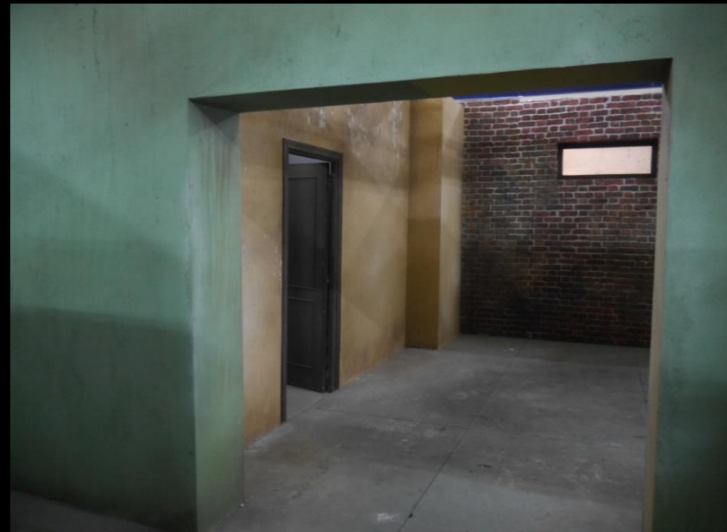
Fig. 02 - Interior Búnquer - Construcción