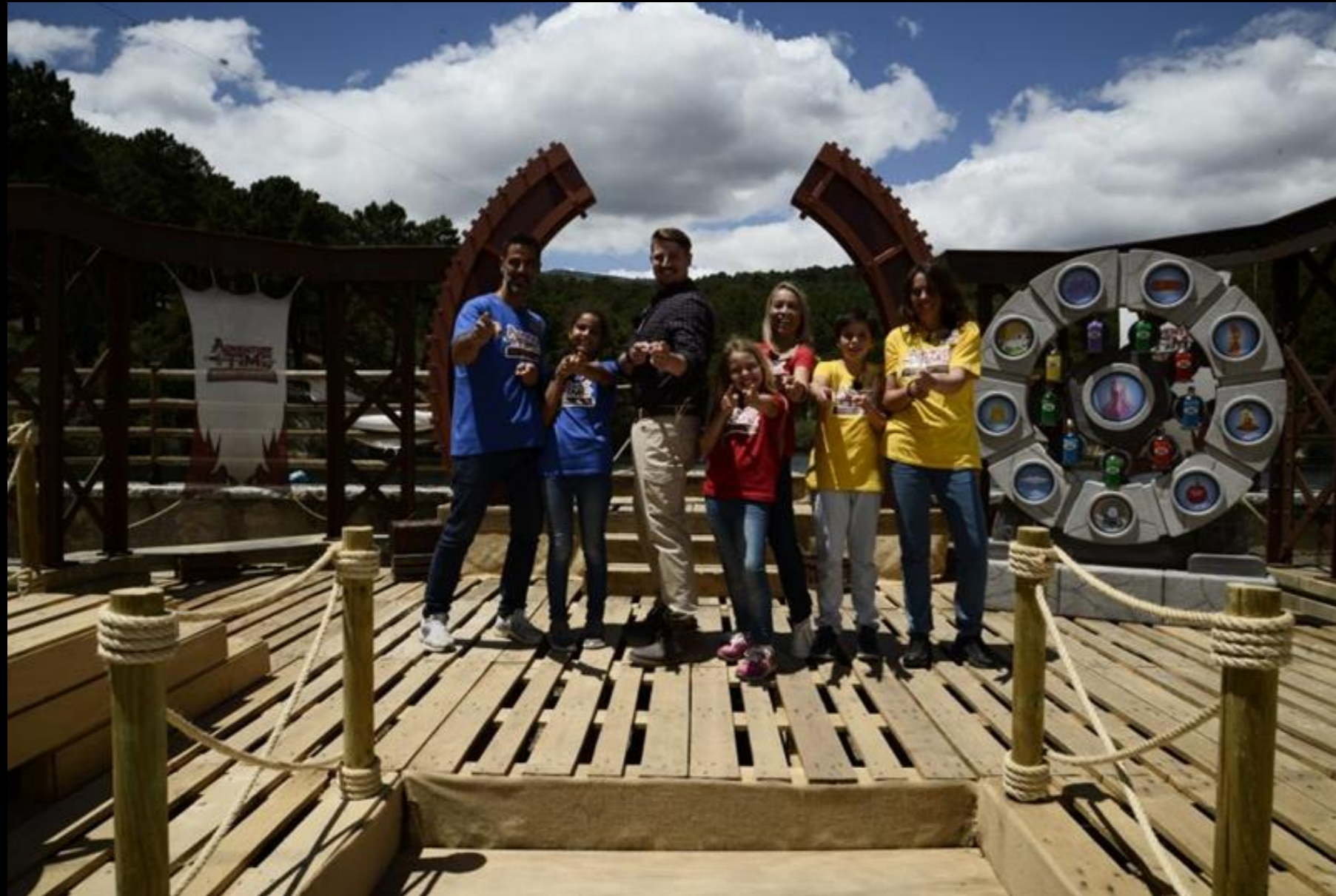
Fig. 01 - Exterior Palafito - Imagen promocional