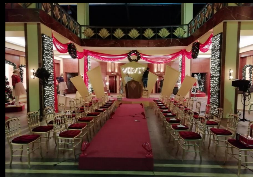
Fig. 06 - Interior pasarela Velvet - Foto fija