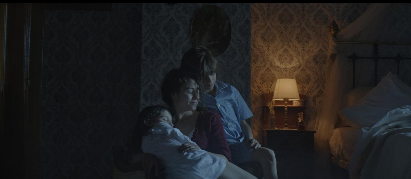
Fig. 02 - Interior dormitorio - Fotograma