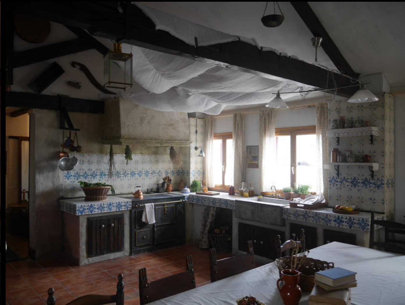
Fig. 02 - Interior Cocina - Foto fija (después de la intervención)