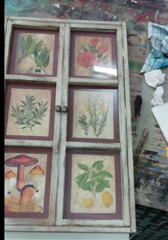
Fig. 06 - Boticario - Construcción