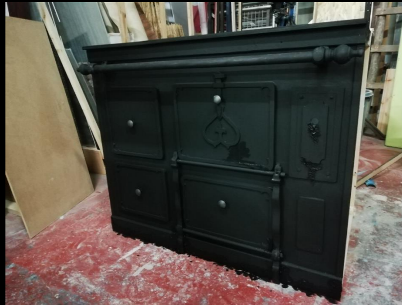
Fig. 02 - Cocina de carbón - Construcción