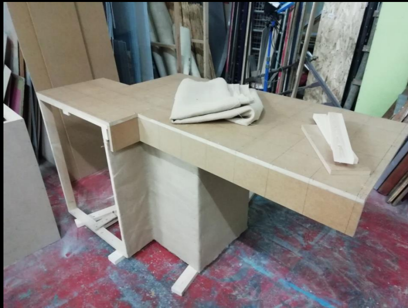
Fig. 01 - Encimera cocina - Construcción