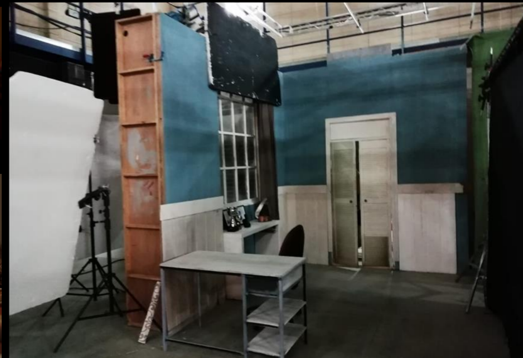
Fig. 07 - Interior casa americana - Construcción