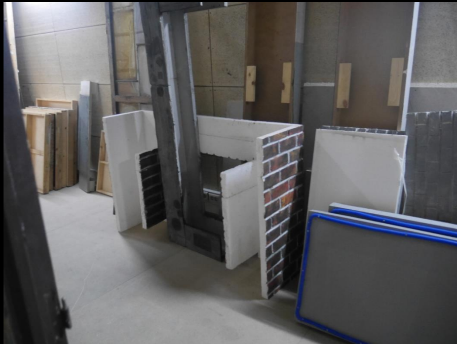
Fig. 02 - Chimenea - Construcción