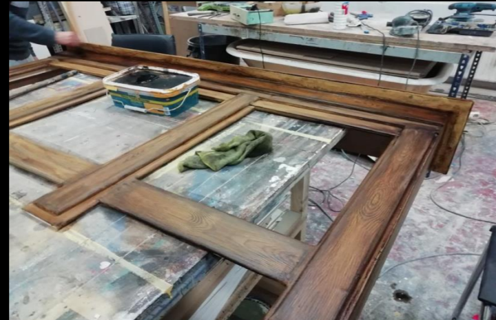
Fig. 05 - Cubre radiador - Construcción