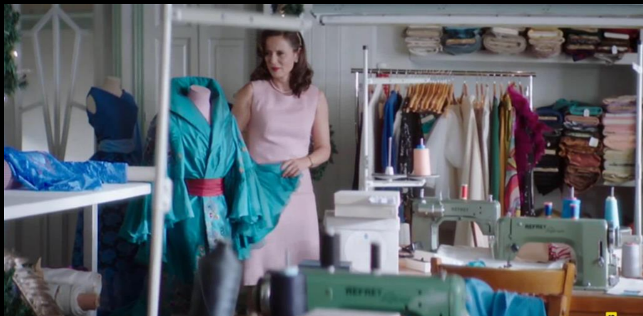
Fig. 01 - Interior Taller de costura - Fotograma