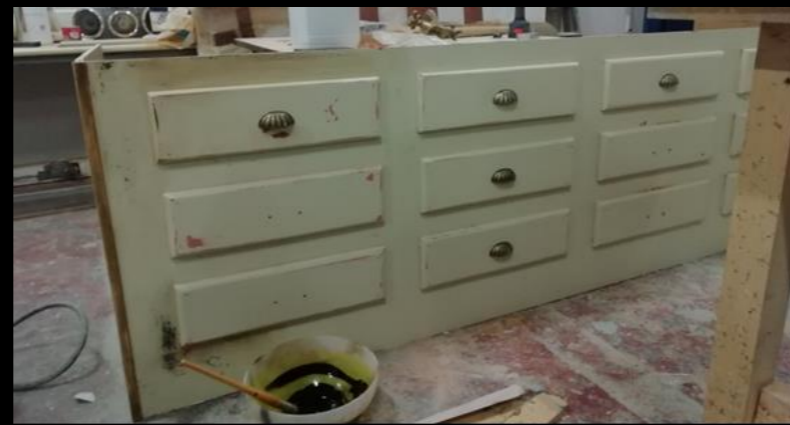
Fig. 08 - Boticario - Construcción