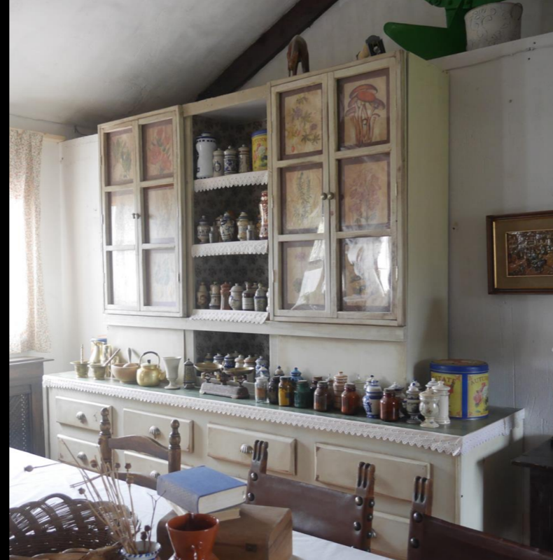
Fig. 03 - Boticario - Foto fija