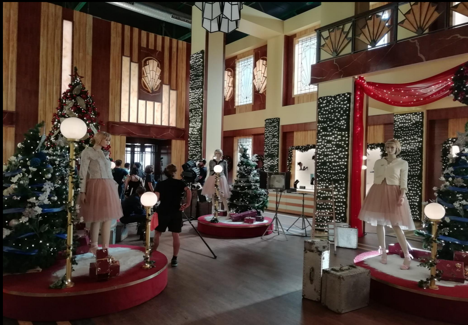
Fig. 01 - Interior Galerías Velvet - Foto fija