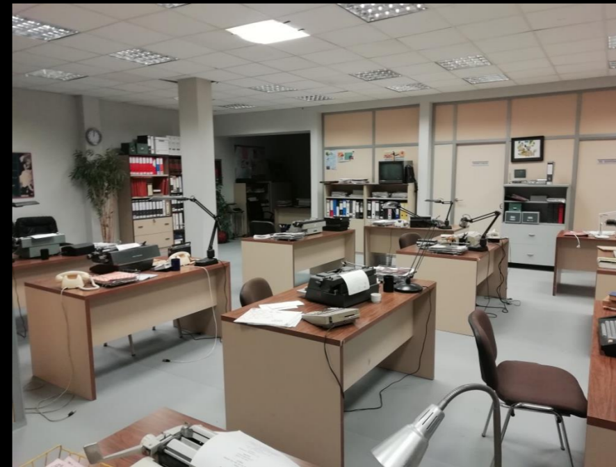
Fig. 03 - Interior oficinas televisión - Foto fija