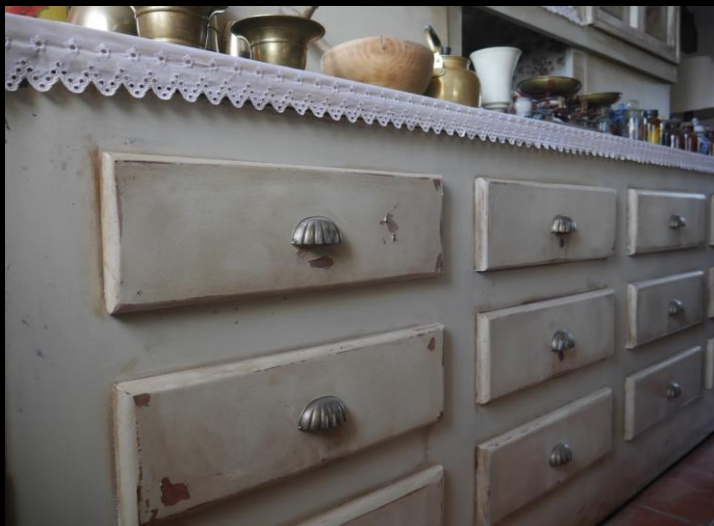
Fig. 01 - Boticario - Detalle ambientación