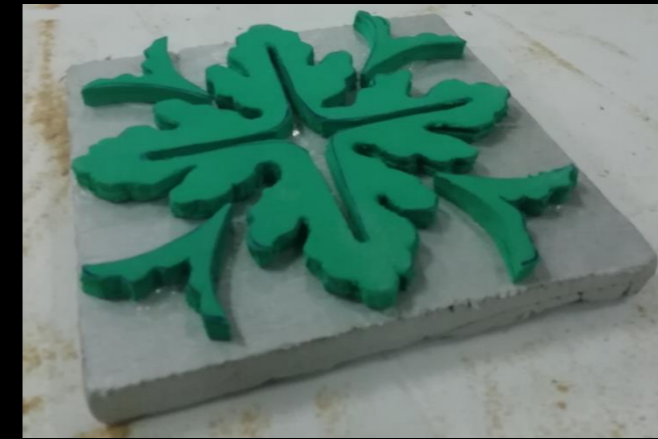
Fig. 03 - Plantilla de goma eva para azulejos