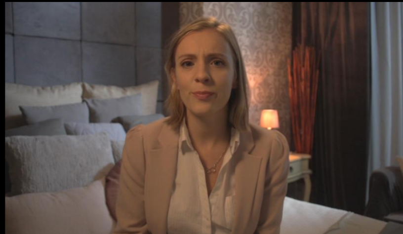
Fig. 02 - Interior habitación hotel - Foto fija