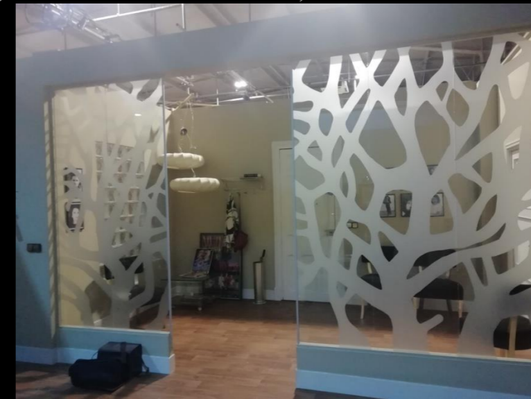
Fig. 06 - Interior despacho CataTalent - Foto fija