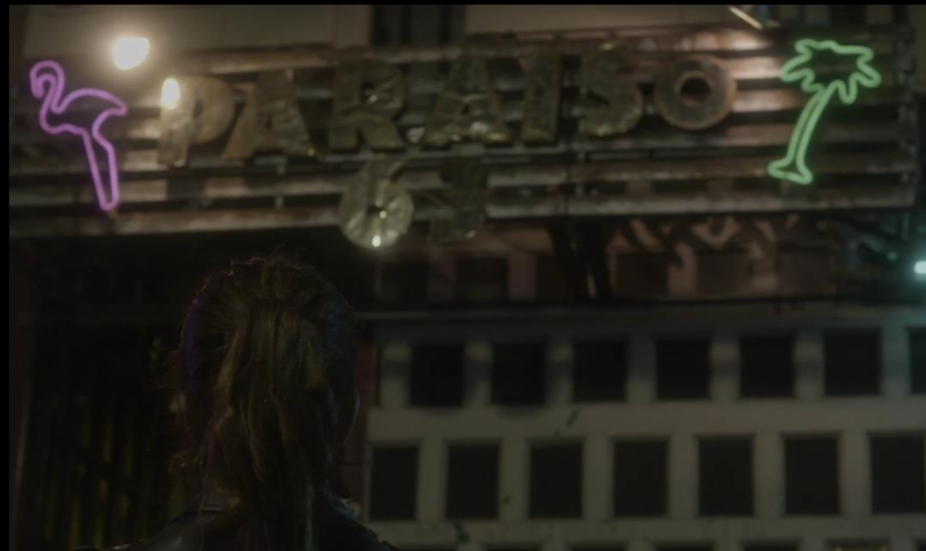
Fig. 02 - Exterior fachada bar - Fotograma