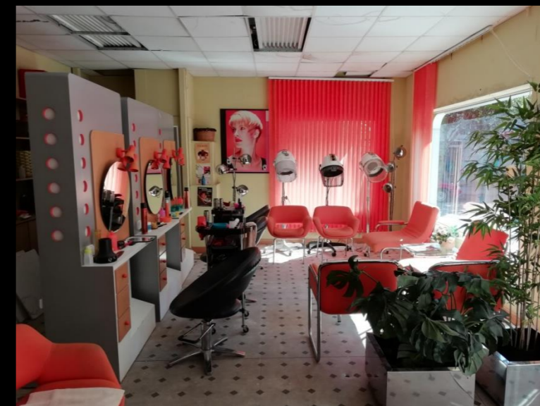
Fig. 06 - Interior Peluquería - Foto fija