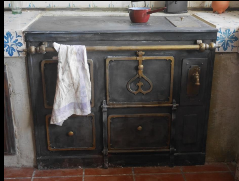
Fig. 04 - Cocina de carbón - Foto fija