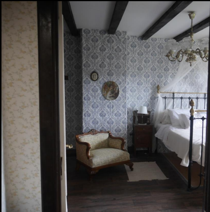
Fig. 01 - Interior dormitorio - Foto fija