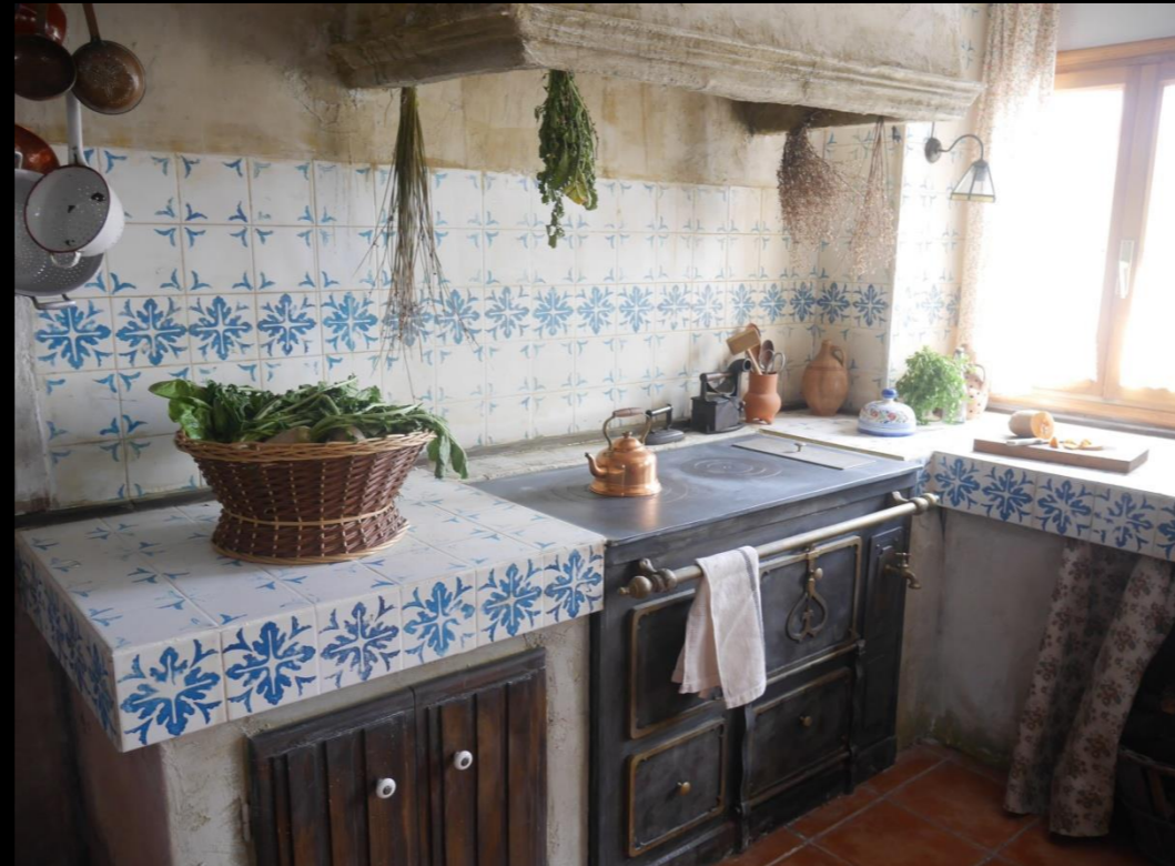
Fig. 06 - Interior Cocina - Foto fija