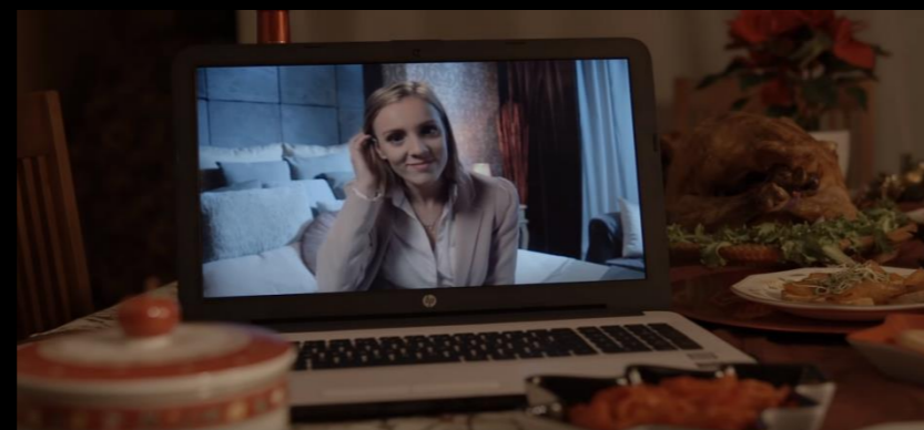
Fig. 06 - Interior salón / habitación hotel - Fotograma