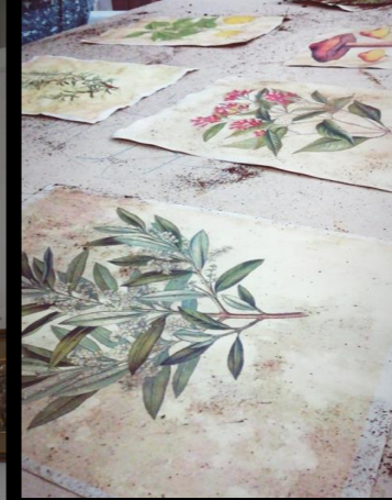
Fig. 04 - Boticario - Construcción