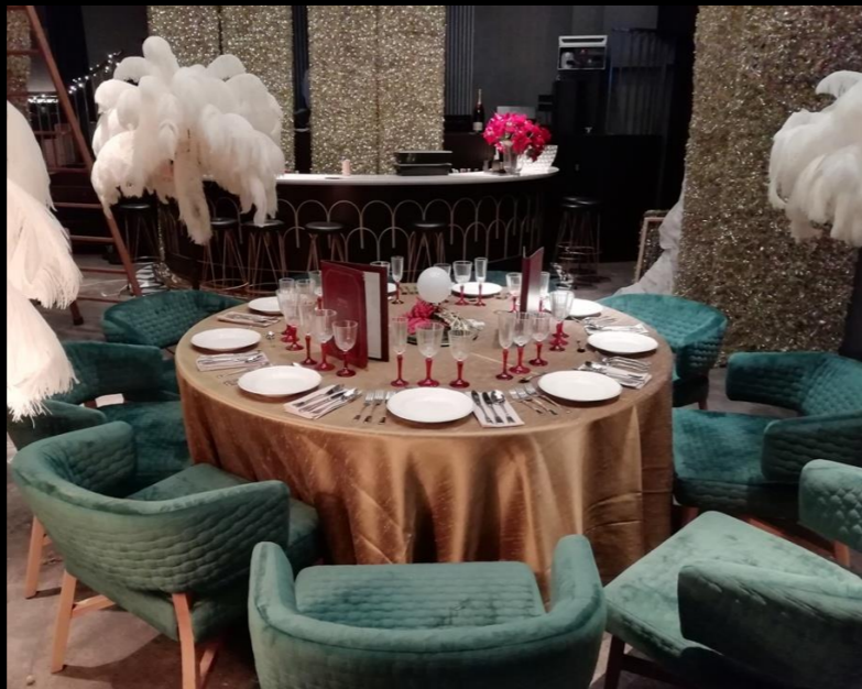
Fig. 02 - Interior restaurante - Foto fija