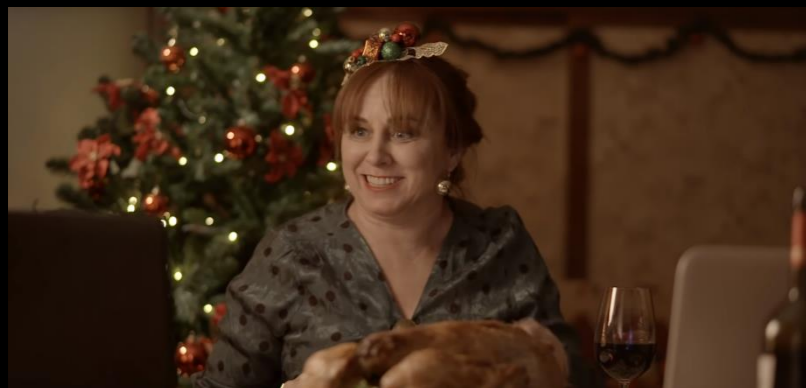
Fig. 05 - Interior salón - Fotograma