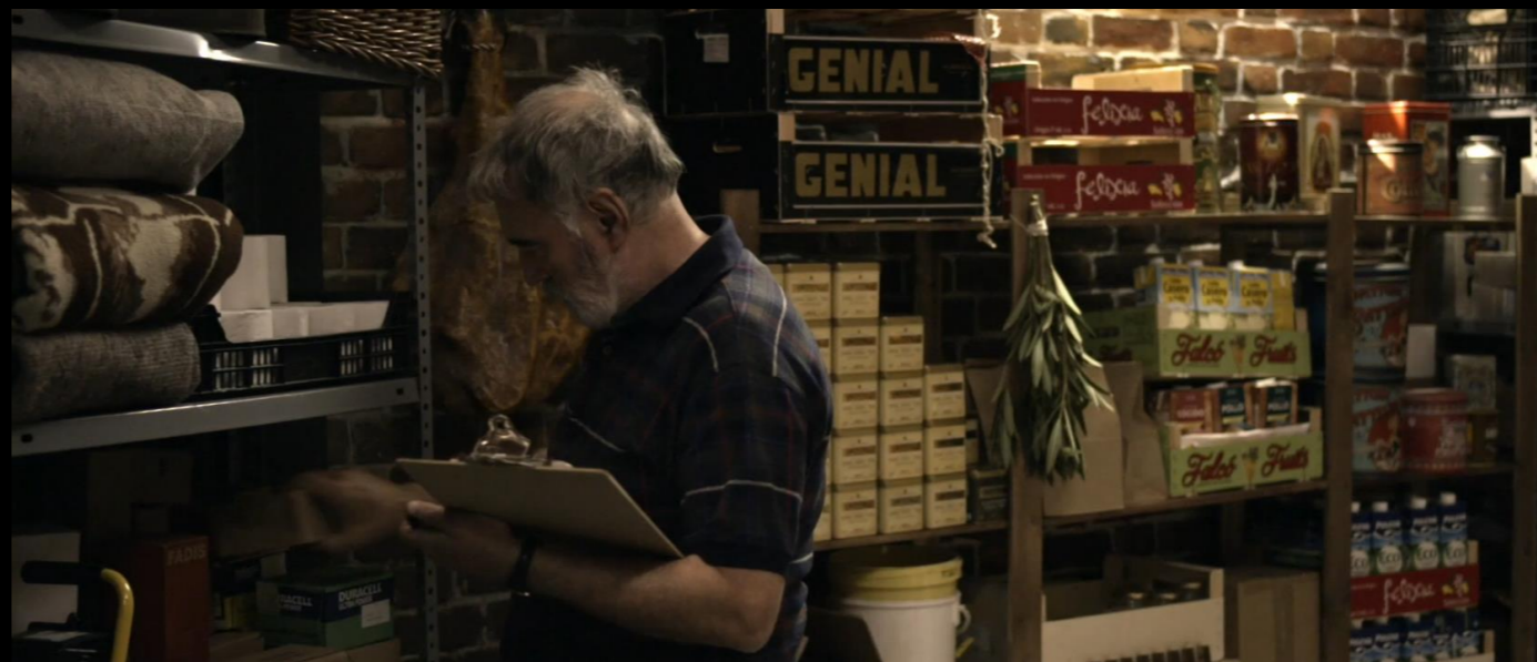
Fig. 05 - Interior Búnquer - Fotograma