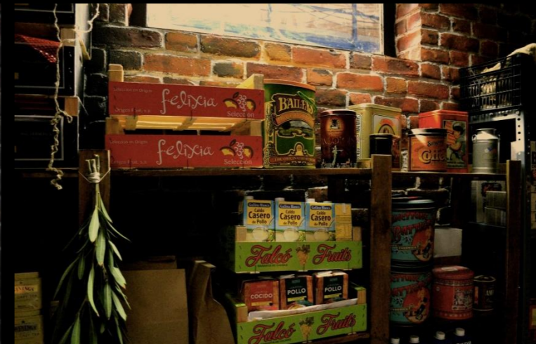
Fig. 07 - Interior Búnquer - Foto fija