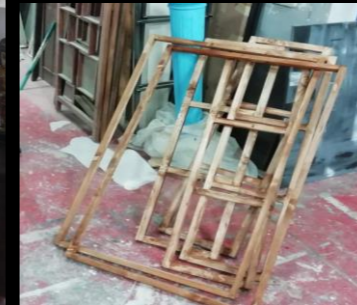
Fig. 05 - Boticario - Construcción