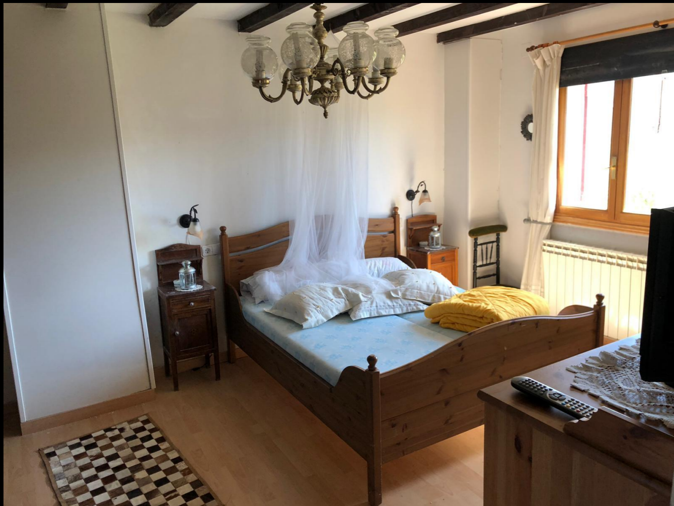
Fig. 01 - Interior Dormitorio - Localización antes de la intervención

Construcción Ambientación - Decoración +34673327643 gonpalacioart@gmail.com www.gonpalacio.com