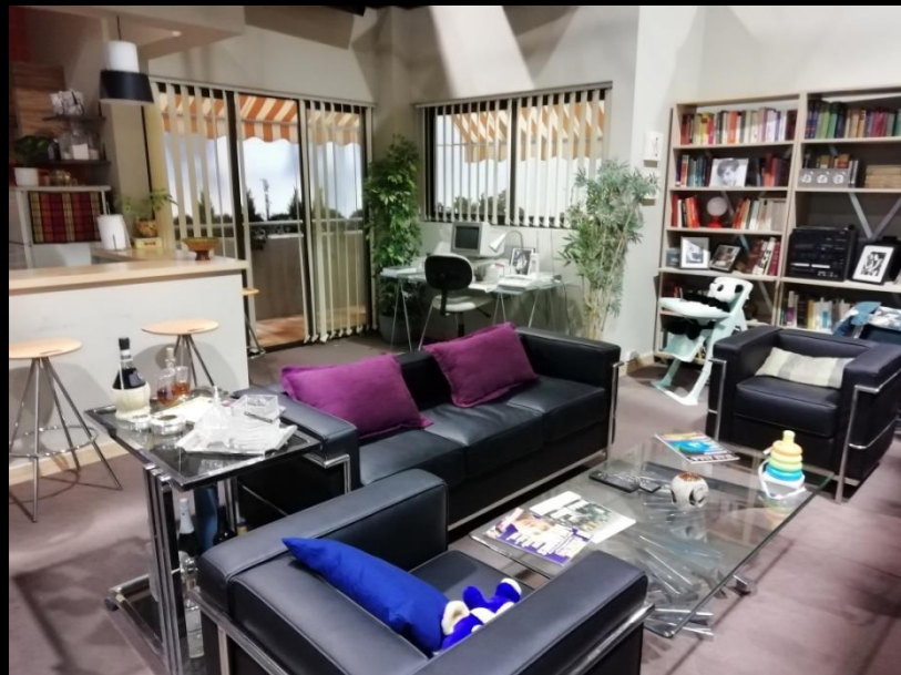
Fig. 01 - Interior casa Toni - Foto fija