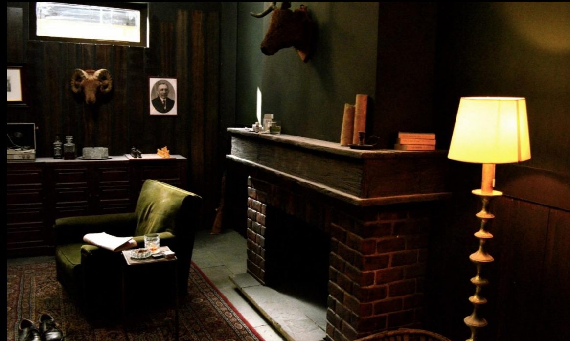
Fig. 03 - Interior Búnquer - Foto fija