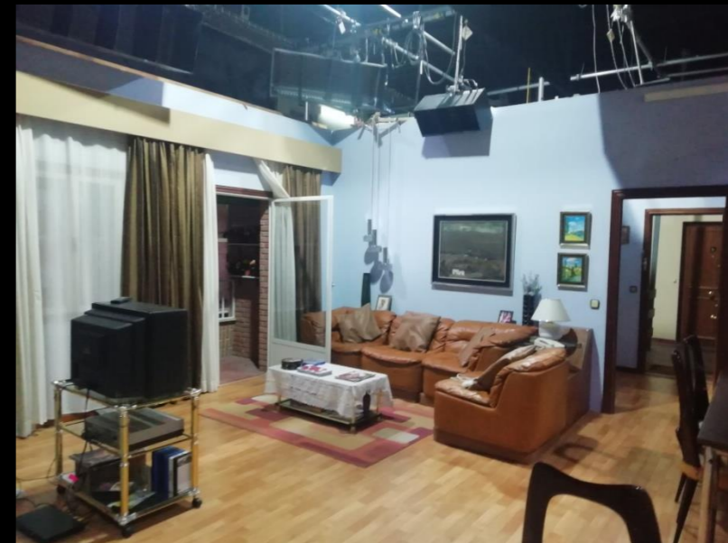
Fig. 03 - Interior casa Alcántara- Foto fija