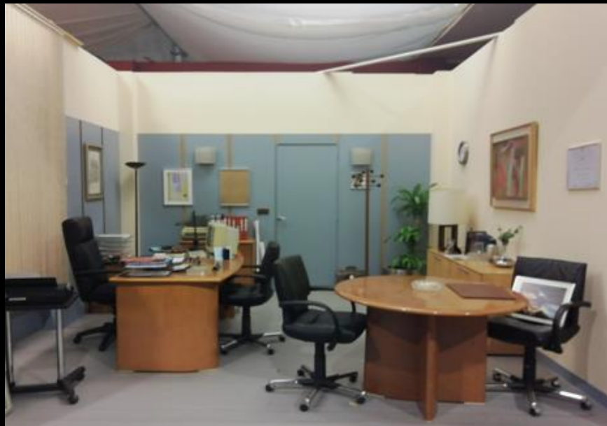
Fig. 01 - Interior Banco - Foto fija