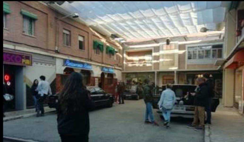
Fig. 02 - Exterior Calle-Plaza de San Genaro - Foto fija