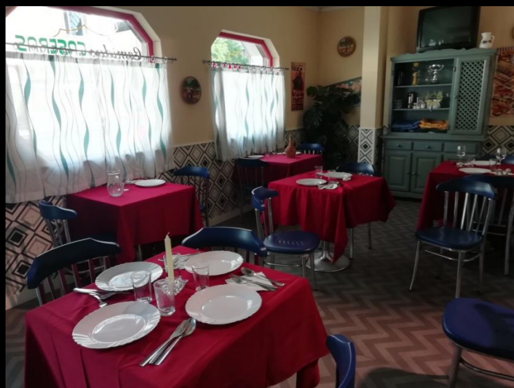
Fig. 04 - Interior Bistrot - Foto fija