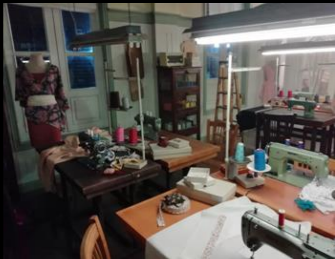
Fig. 01 - Interior taller de costura - Foto fija