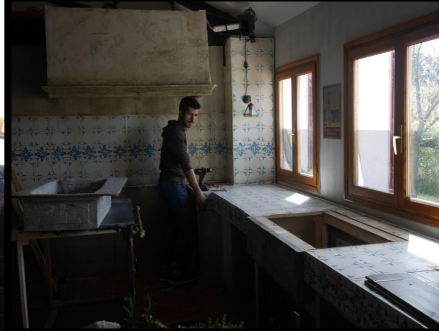
Fig. 07 - Interior Cocina - Instalación en localización real