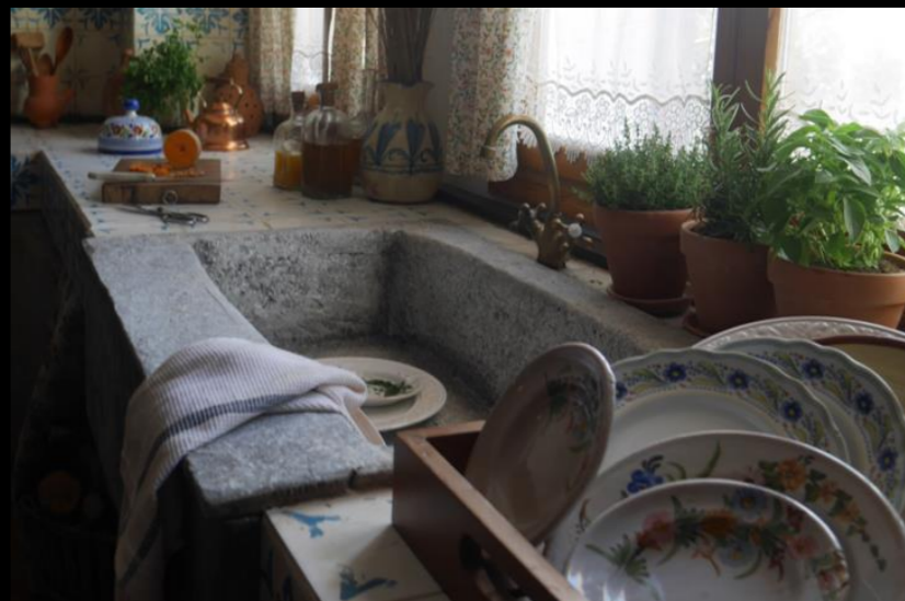
Fig. 08 - Pila de piedra - Foto fija