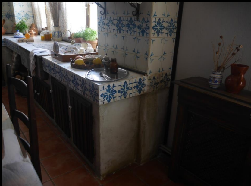
Fig. 05 - Interior Cocina - Foto fija