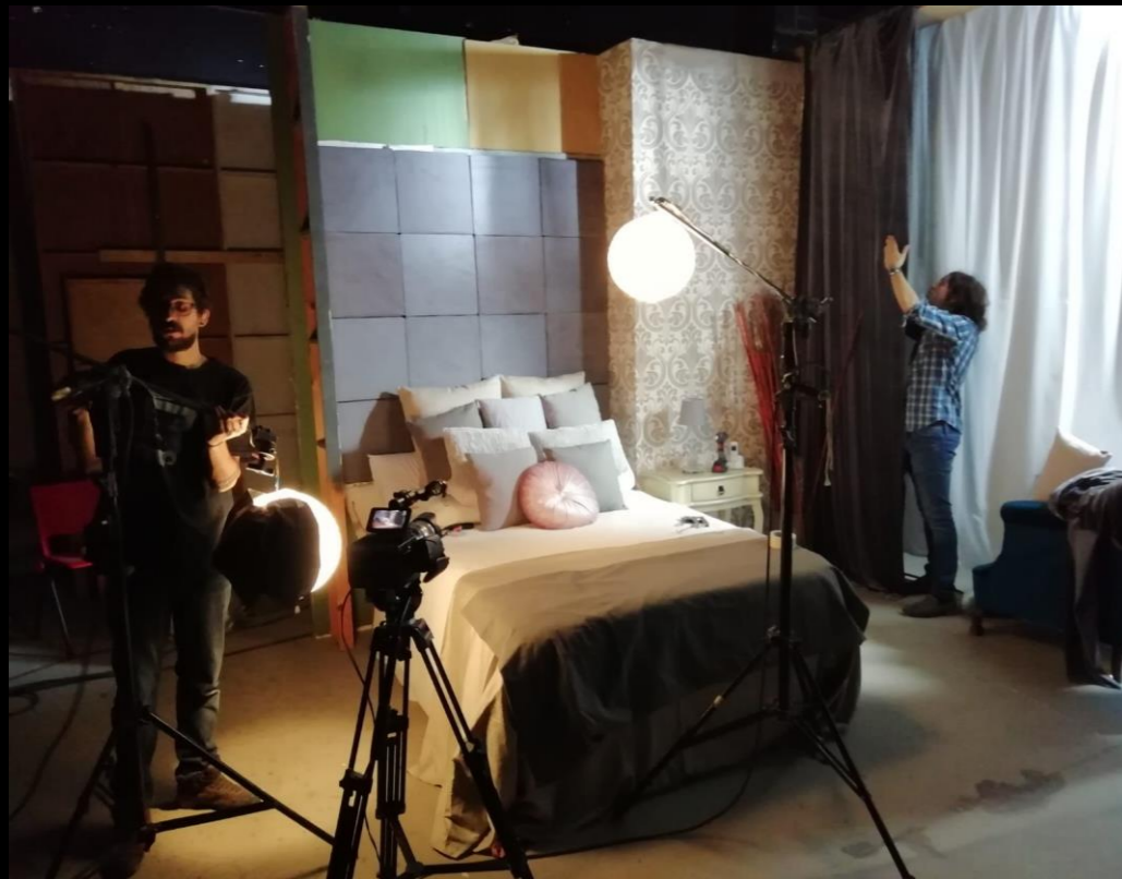
Fig. 01 - Interior habitación hotel - Foto fija