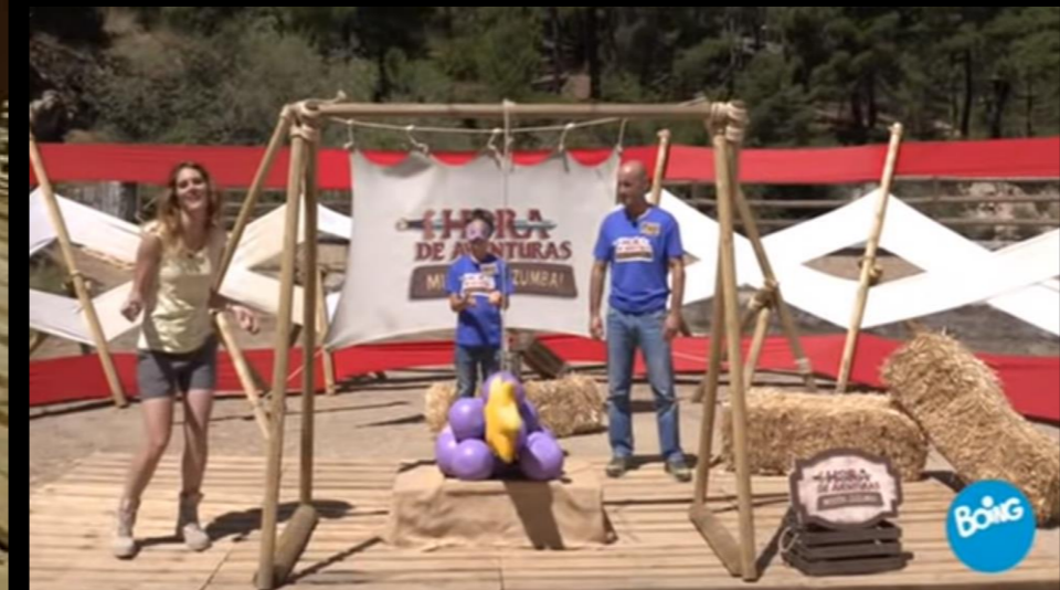
Fig. 03 - Exterior Palafito - Fotograma