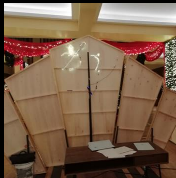
Fig. 05 - Pasarela en construcción