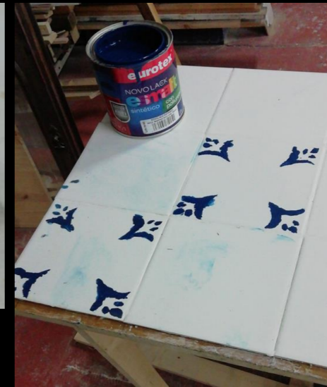
Fig. 04 - Azulejos - Prueba de pintura