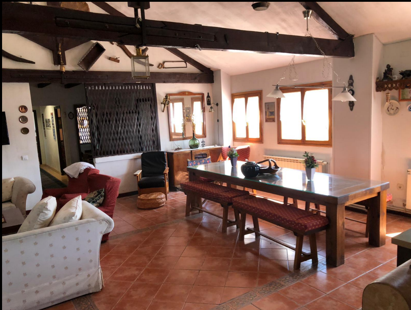
Fig. 01 - Interior Salón - Localización antes de intervenir

Construcción Ambientación - Decoración +34673327643 gonpalacioart@gmail.com www.gonpalacio.com