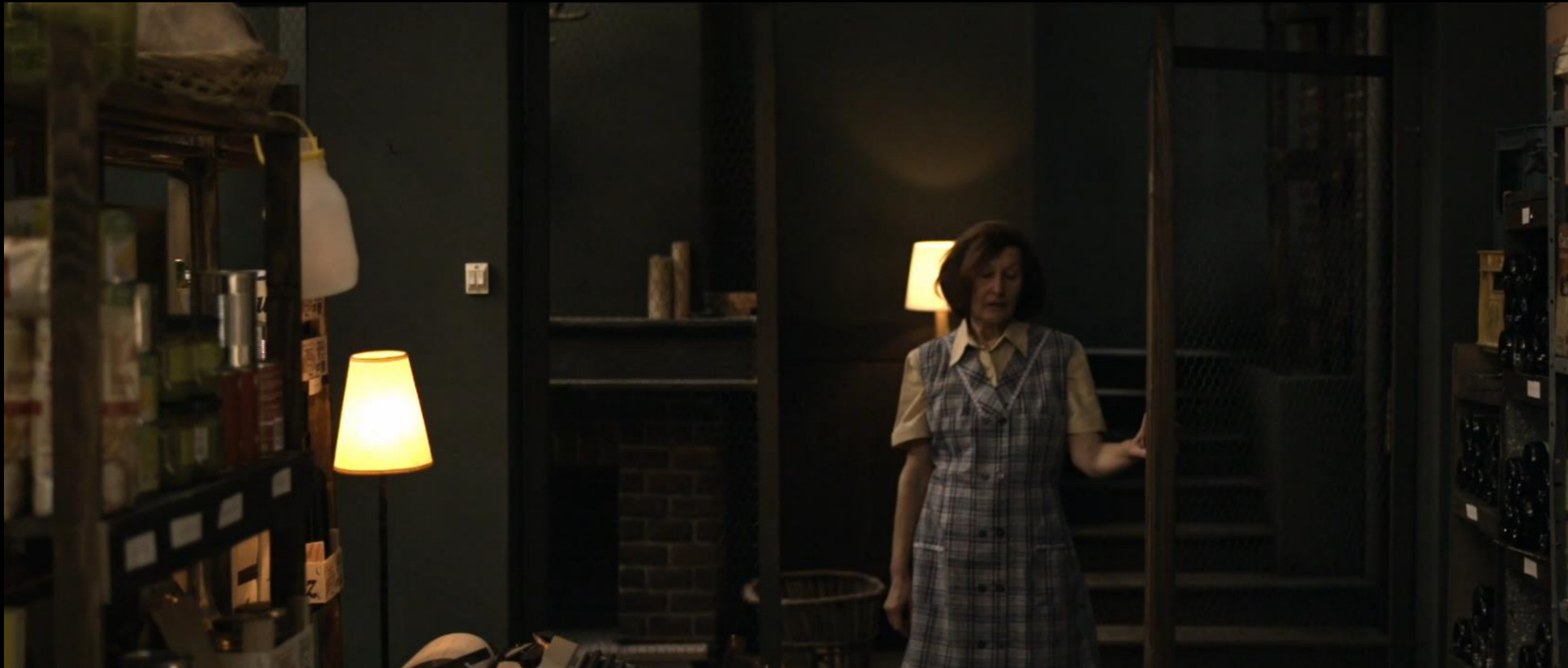
Fig. 01 - Interior Búnquer - Fotograma