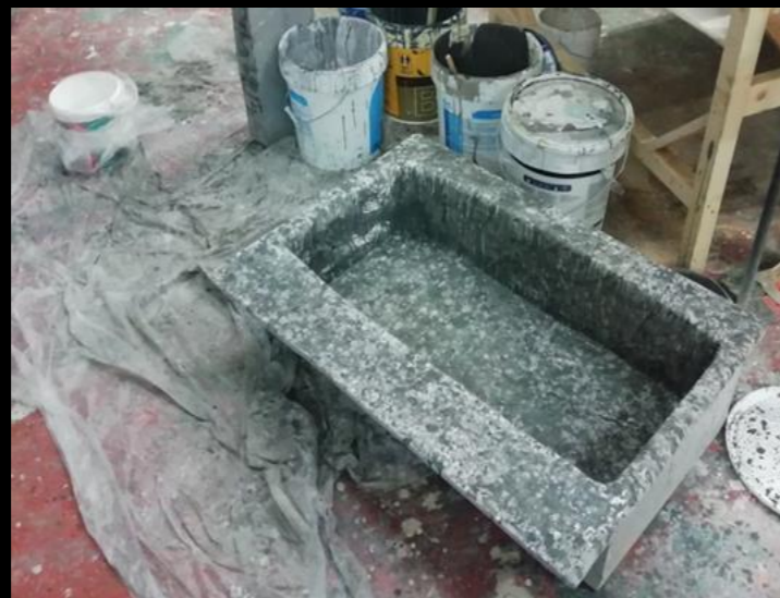
Fig. 06 - Pila de piedra - Construcción