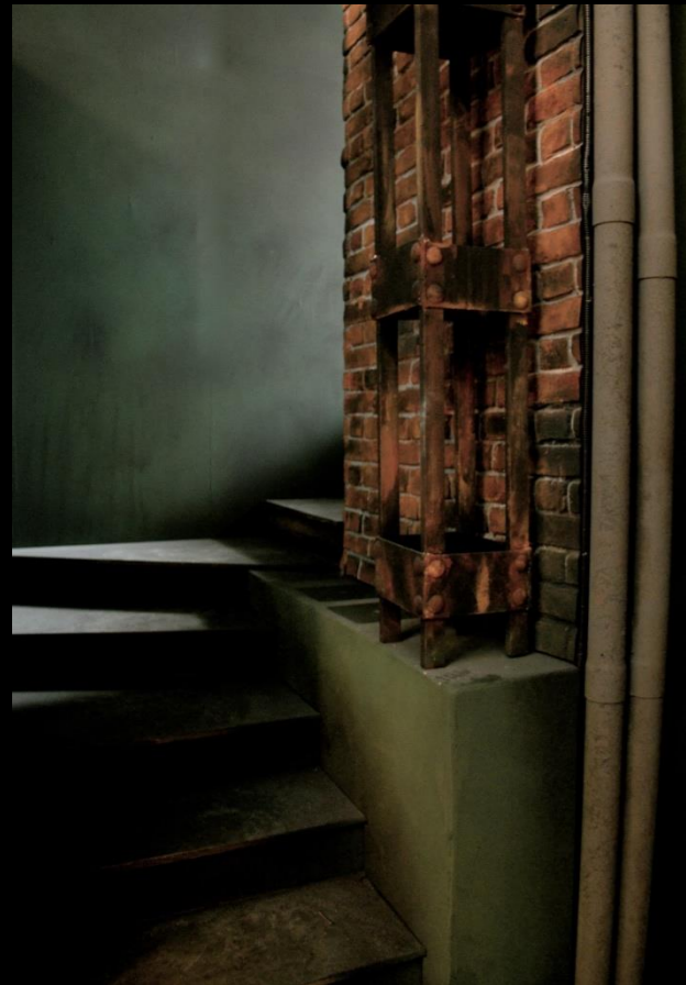
Fig. 01 - Interior Búnquer - Foto fija