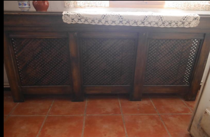
Fig. 06 - Cubre radiador - Foto fija