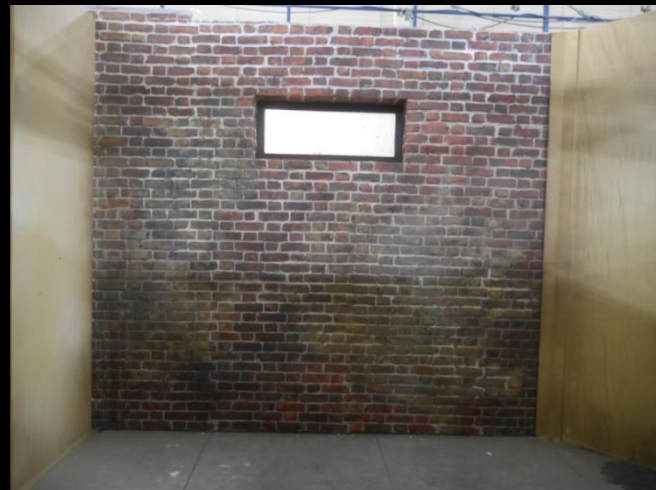
Fig. 05 - Interior Búnquer - Construcción