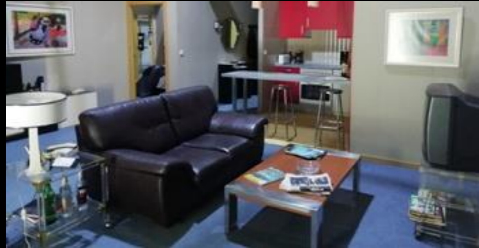
Fig. 05 - Interior casa Antonio - Foto fija