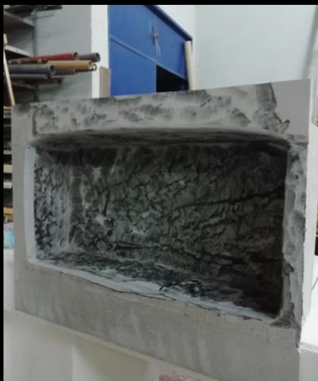
Fig. 05 - Pila de piedra - Construcción