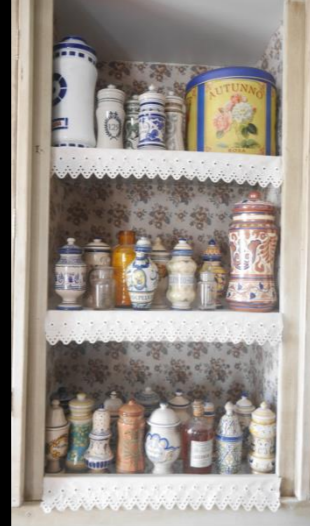
Fig. 02 - Boticario