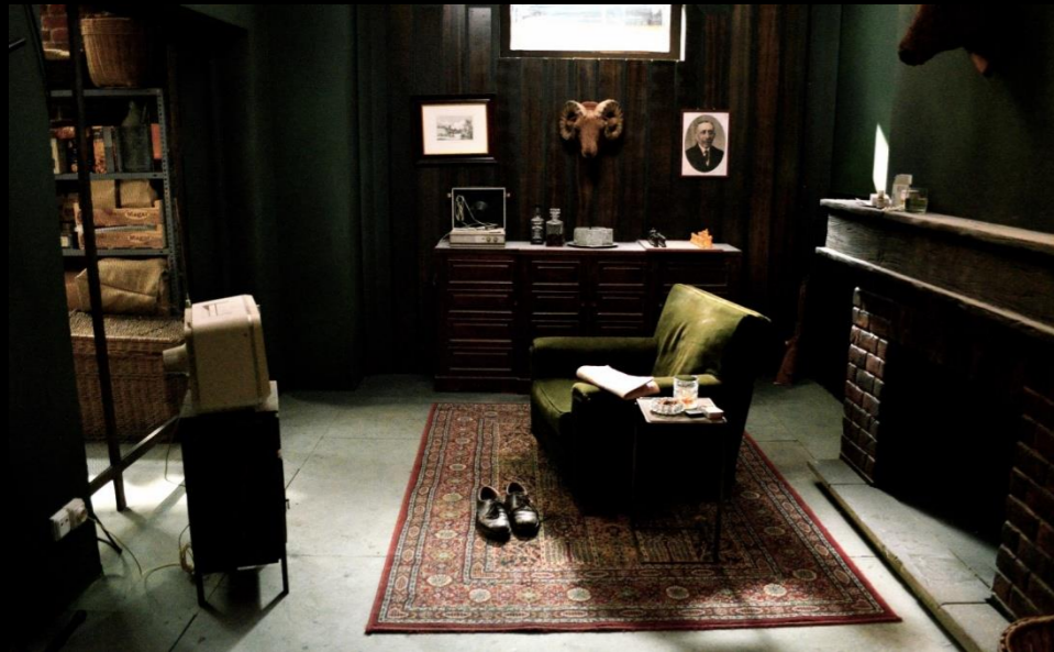
Fig. 01 - Interior Búnquer - Foto fija