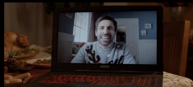
Fig. 04 - Interior salón / casa americana - Fotograma