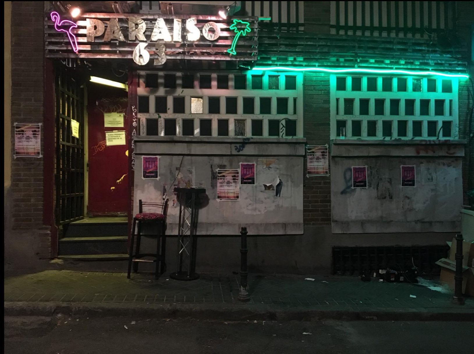
Fig. 03 - Exterior fachada bar - Foto fija