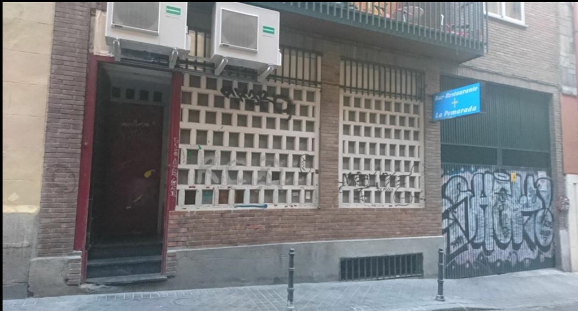
Fig. 01 - Exterior fachada bar - Localización antes de la intervención