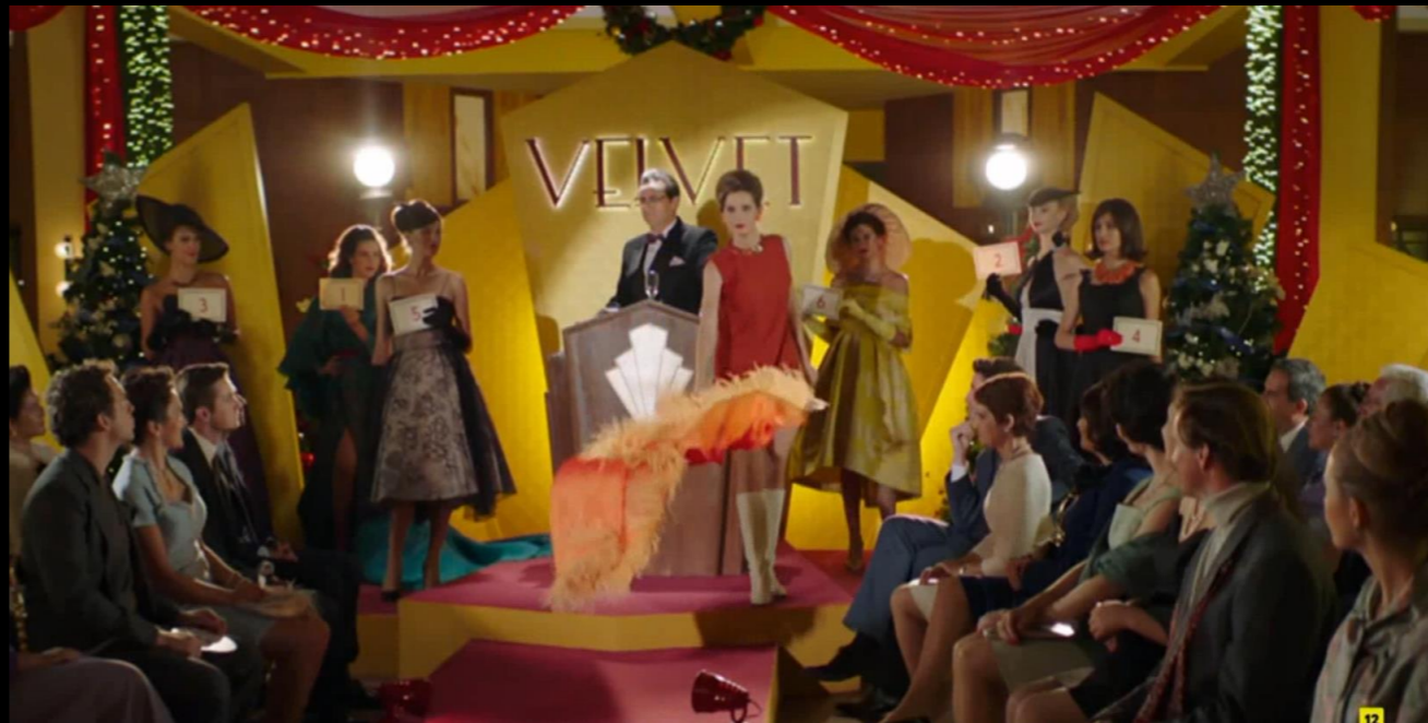
Fig. 03 - Interior pasarela Velvet - Fotograma