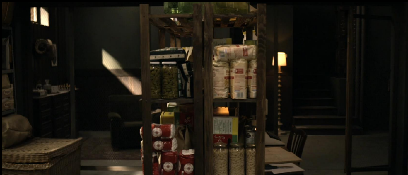
Fig. 04 - Interior Búnquer - Fotograma