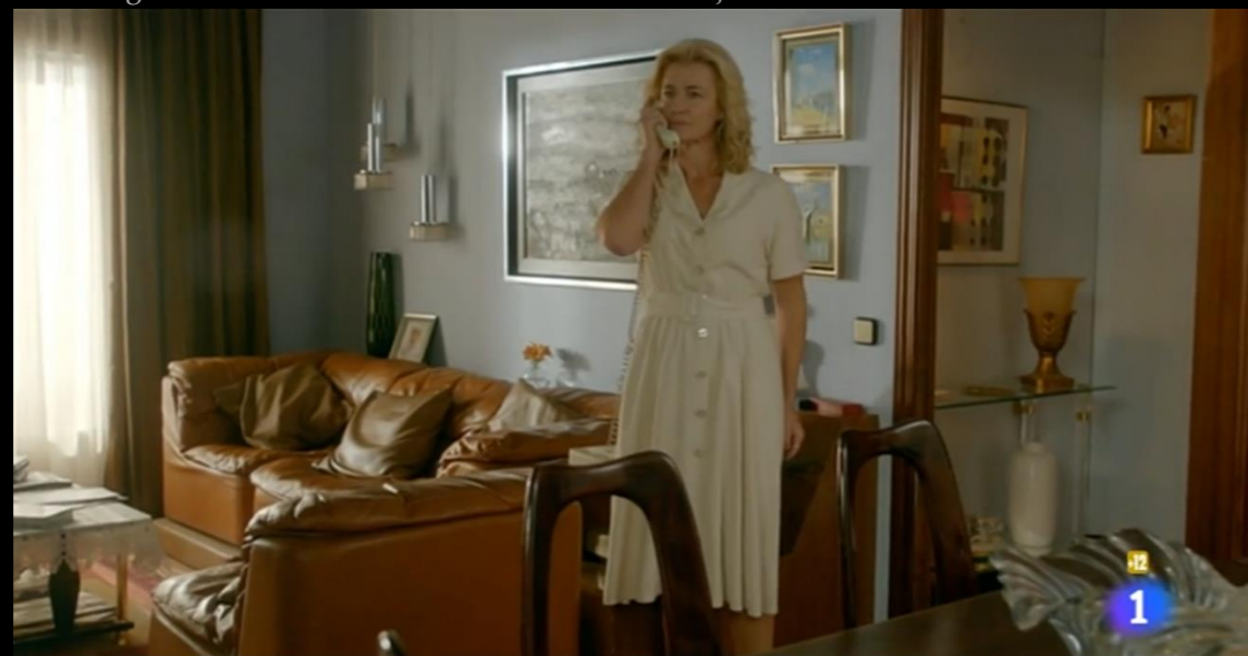
Fig. 05 - Interior casa Alcántara- Fotograma