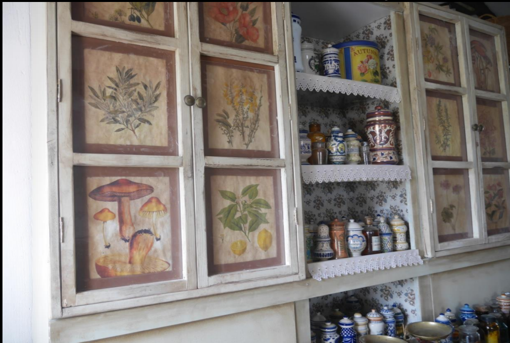
Fig. 07 - Boticario - Foto fija