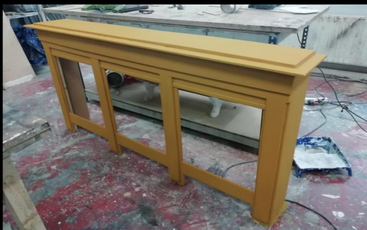
Fig. 03 - Cubre radiador - Construcción