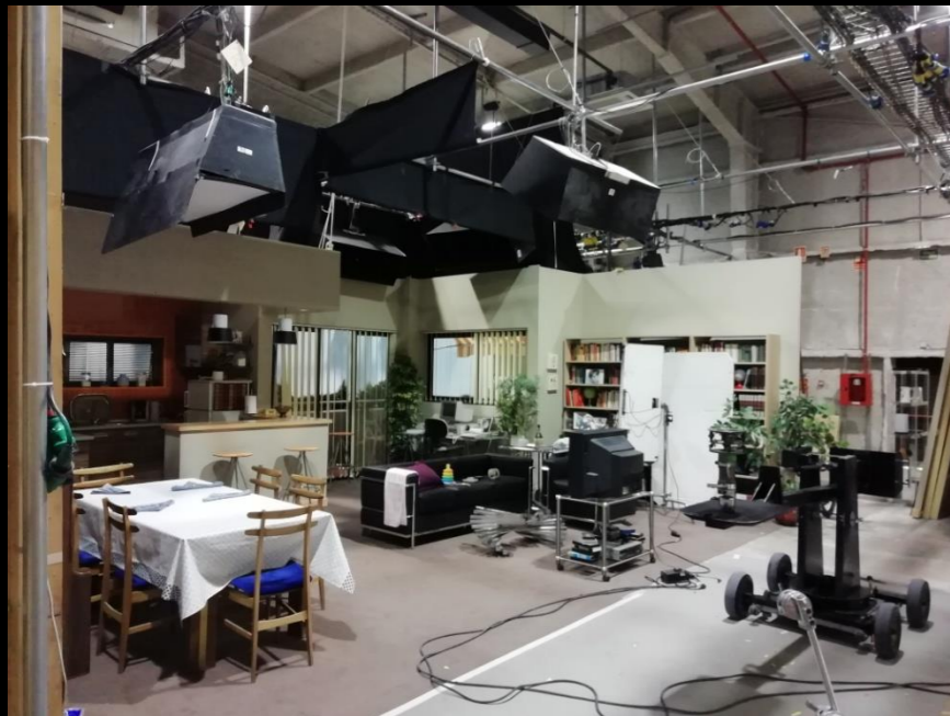
Fig. 04 - Interior casa Toni - Foto fija