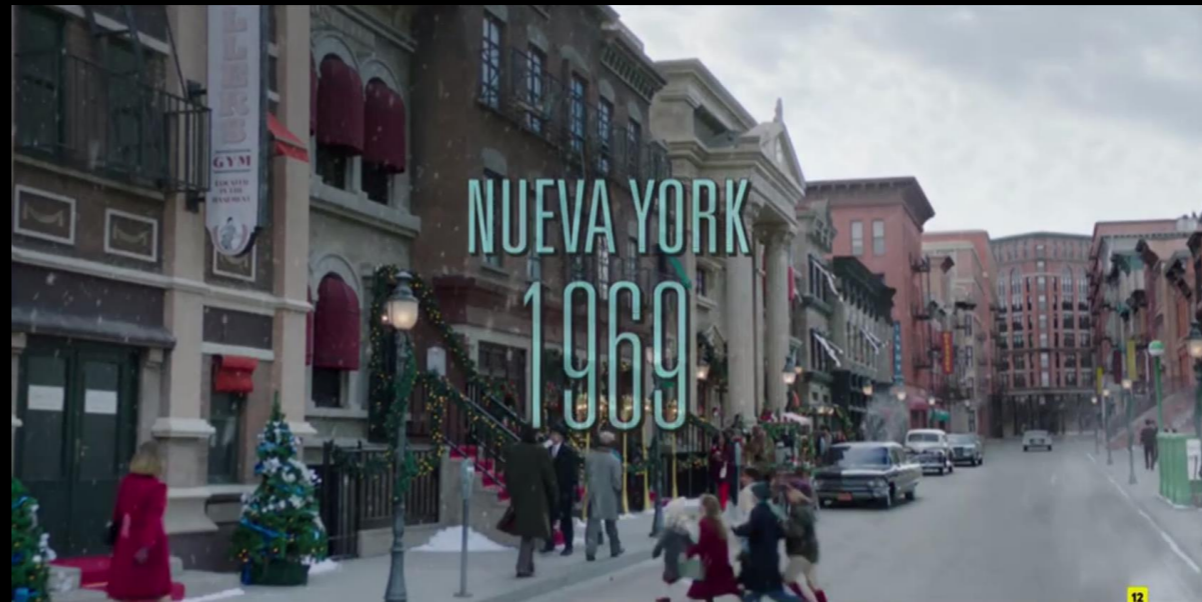
Fig. 02 - Exterior Nueva York - Fotograma