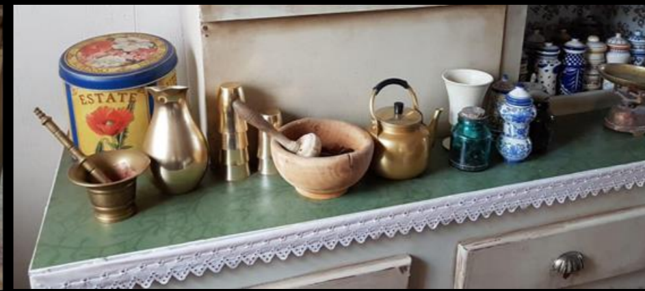
Fig. 09 - Boticario - Detalle atrezzo