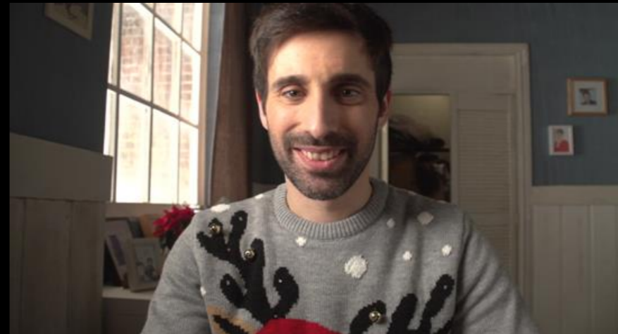
Fig. 03 - Interior casa americana - Foto fija