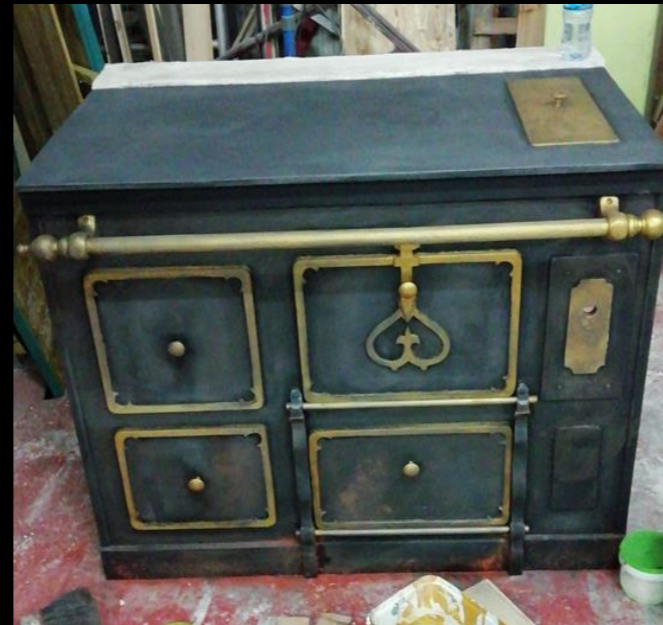
Fig. 03 - Cocina de carbón - Construcción