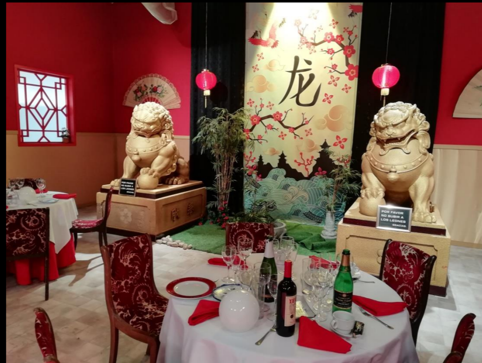
Fig. 02 - Interior restaurante chino - Foto fija