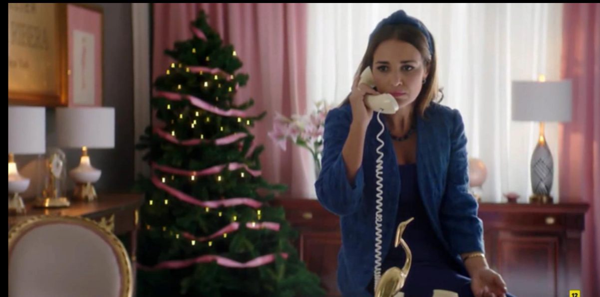
Fig. 03 - Interior despacho Ana Ribera - Fotograma