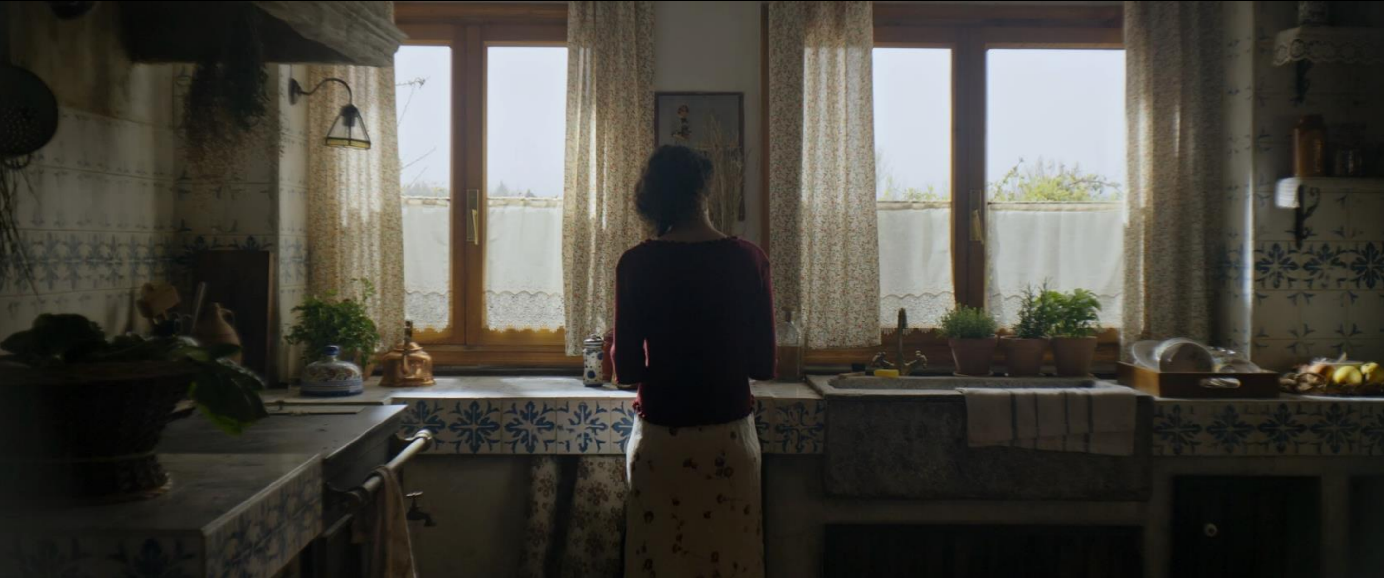
Fig. 01 - Interior Dormitorio - Fotograma

Construcción Ambientación - Decoración +34673327643 gonpalacioart@gmail.com www.gonpalacio.com