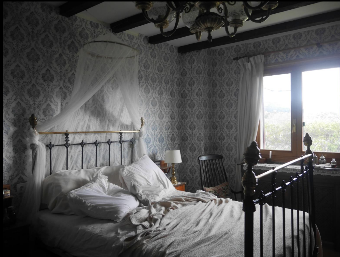
Fig. 02 - Interior Dormitorio - Localización después de la intervención