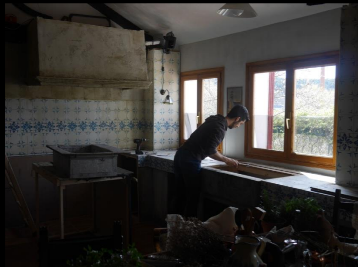
Fig. 07 - Pila de piedra - Instalación en localización