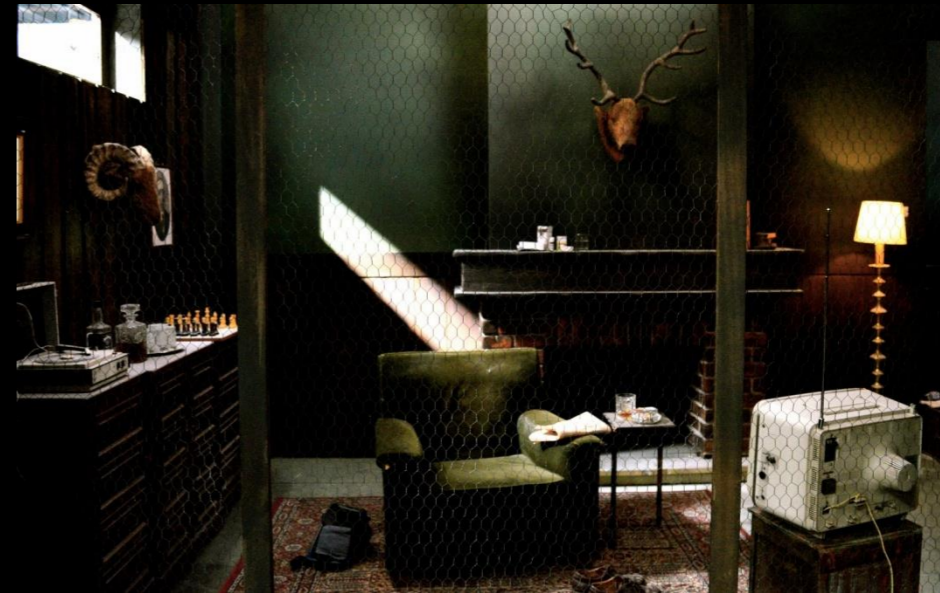
Fig. 03 - Interior Búnquer - Foto fija